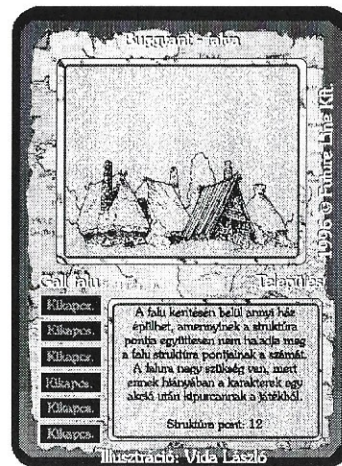
Illusztráció: Vida László

Egy éjjel aztán a sok munkától fáradt rajzolók már nem bírták tovább. Mogorva szemekkel méregették egymás munkáját, amikor a füzetek lapjain megmozdultak a figurák, s életre kelt a római tábor, a városok és falvak népe, hogy mindent eldöntő, rekeszizom szagató csatában eldöntsék, hogy melyikük kerül ezentúl a olvasók kezébe.